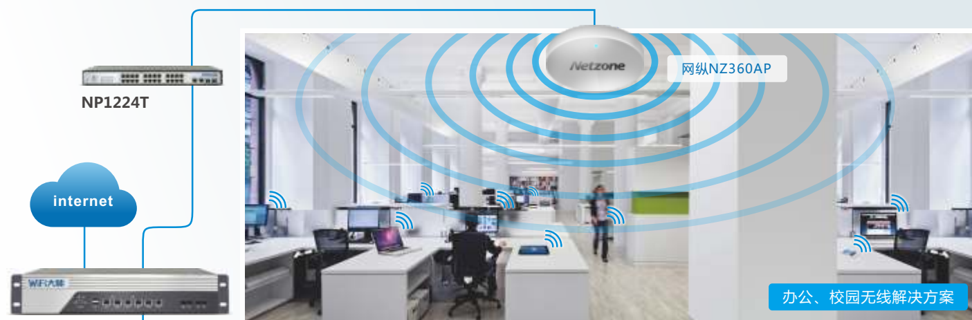
办公、校园无线解决方案